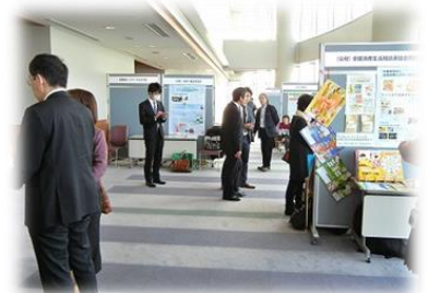
壁新聞交流会の様様