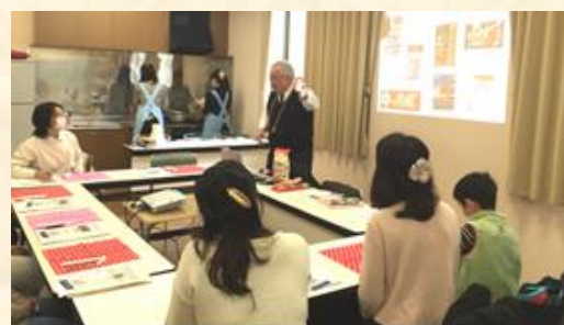
↑わかやま市民生協コープ岩出中央店での実践

消費者からは「はじめは討論時間が長いと思いましたが、色々な業種の方がいて、話しているうちにあっという間でした。とても良い刺激になりました」「メーカーさんとむっちゃ近い距離感で話ができ新鮮。すごくよかった」。事業者からは「CM出稿に何千何億円かけるより、実践の場に対応すれば個々に残るインパクトは強く、最終的に事業者側は企業価値を上げられ、消費者側にもメリットがあって win-win だと思っている。実際には“費用対効果”を求められて社内合意を得るのが難しいのがジレンマです」「事業者と消費者の接点は重要であり、貴重な機会であることを改めて認識しました」などの意見をいただきました。