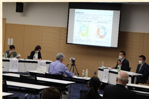
↑昨年3月の消費者ネットワークわかやま公開学習会「消費者と企業の双方向コミュニケーションが私達にもたらすもの」より

KC'sは、消費者被害を生む事業活動に対し差止請求を行っていく一方で、消費者と志のある事業者は、立場は違っても、お互いにコミュニケーションをとることが信頼関係の構築の土台になり、消費者市民社会の実現につながっていくのではないかと、との仮説から、2010 年から「双方向コミュニケーション研究会」を立ち上げました。また 2012 年から事業者と少人数の消費者が膝を突き合わせて懇談する「双方向コミュニケーション実践の場」を開始し、わかやま市民生協様にもご協力いただいております。